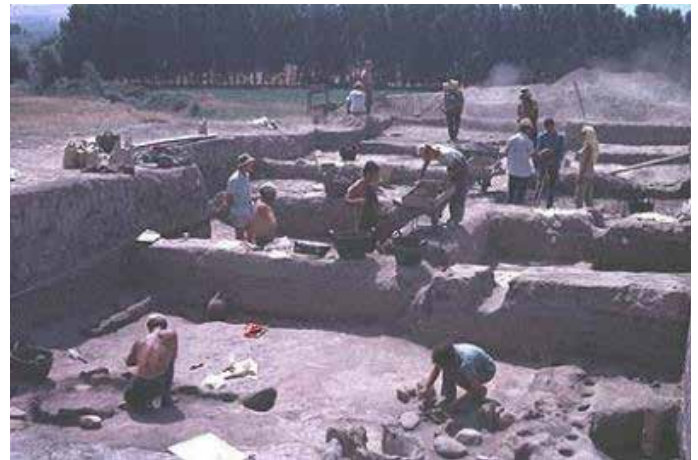
Ανασκαφή 1968 - 1971

Τα αρχαιολογικά ευρήματα από τη θέση εκτίθενται στο Αρχαιολογικό Μουσείο της Δράμας